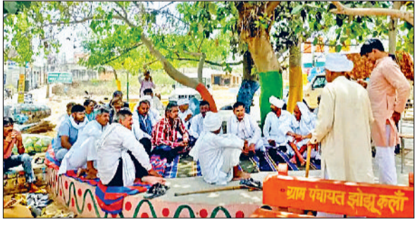
भिवानी। किसानों को संबोधित करते वक्ता। फोटो: हरिभूमि

किसानों को संबोधित करते वक्ता। फोटो: हरिभूमि