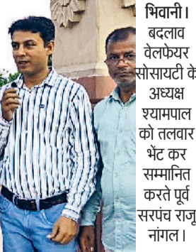
शान कायम रखते हुए महाराणा प्रताप ने मुगलों की गुलामी स्वीकार करने की बजाय वनों में रहना उचित समझा तथा वतन की रक्षा के लिए