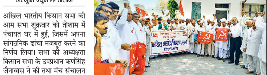
भिवानी। लंबित मांगों को लेकर विरोध जताते अखिल भारतीय किसान सभा के पदाधिकारी व सदस्य।