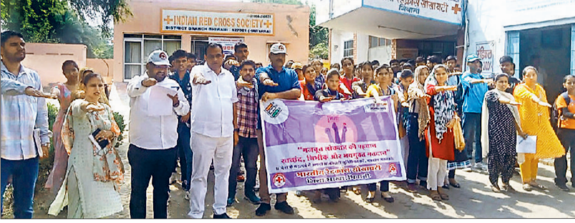
भिवानी। युवाओं को मतदान करने की शपथ दिलवाते रेडक्रॉस सचिव।

योग्य व सक्षम प्रतिनिधि के चयन के लिए मत का प्रयोग जरूरी: सचिव हरिभूमि न्यूज