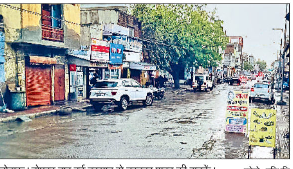
लोहारु। दोपहर बाद हुई बरसात से तरबतर शहर की सड़कें।

पिछले लगातार तीन दिनों से इलाके में चिलचिलाती धूप और लगातार बढ़ रहे दिन के तापमान ने आम आदमी को घरों में टुबकने को मजबूर कर दिया था वहीं शुक्रवार को दोपहर बार अचानक मौसम में हुए परिवर्तन और तेज हवाओं के साथ हुई बरसात ने लोगों को गर्मी से राहत प्रदान की।