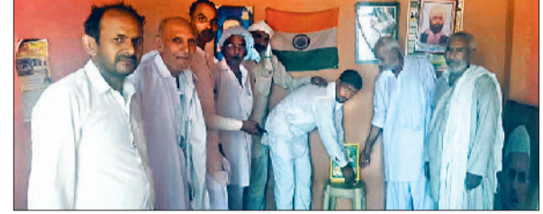
तोशाम। भगवान परशुराम को नमन करते ग्राम स्वराज किसान मोर्चा के पदाधिकारी।