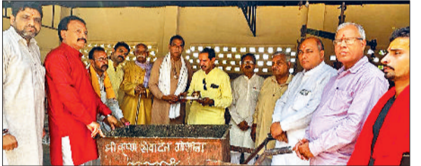
तोशाम। गौशाला में सवामणी लगाते सभा पदाधिकारी।