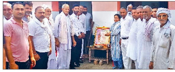
बवानीखेड़ा। भगवान परशुराम के चित्र के समक्ष पुष्पजलि अर्पित करते शहीद जनकल्याण समिति व हरियाणा जाग्रति मोर्चा के पदाधिकारी।