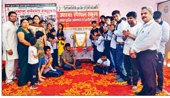
भिवानी। भगवान परशुराम को नमन करते अतिथि, शिक्षक व दिव्यांग बच्चे।

आस्था स्पेशल स्कूल में मनाई भगवान परशुराम की जयंती