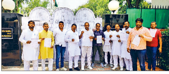
बवानीखेड़ा। उपायुक्त के आवास पर ज्ञापन देने जाते गांवों के लोग।

एनएचएआई 148 बी के खेतों के रास्ते इंट्री व एक्जिट तथा सिंचाई के नाले, पुलों की ऊँचाई तथा सेवा सड़क उपयुक्त आदि मांगे पूरी न होने को लेकर 8 गांवों की पंचायत ने लोकसभा चुनावों के बहिष्कार का ऐलान कर दिया और भिवानी उपायुक्त निवास स्थान पर पहुंचकर उपायुक्त को शिकायत पत्र साँपा व हरियाणा चुनाव आयोग, मुख्य चुनाव आयुक्त भारत सरकार को भी पत्र भेजे। उल्लेखनीय है कि पिछले एक सप्ताह से अधिक समय से बड़सी गुजरान, बड़सी जाटान,