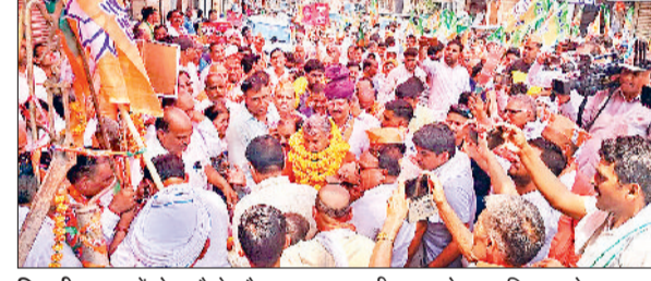
भिवानी। शहर में रोड शो के दौरान भाजपा उम्मीदवार को सम्मानित करते हुए।